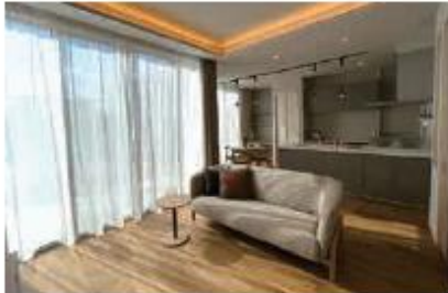
3mの高天井と2.7mのハイサッシでゆとりのあるリビング ※実際の写真です