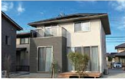
高耐久の瓦屋根・外装材 ※実際の写真です