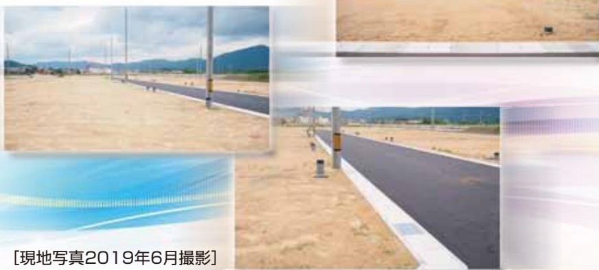
【現地写真2019年6月撮影】