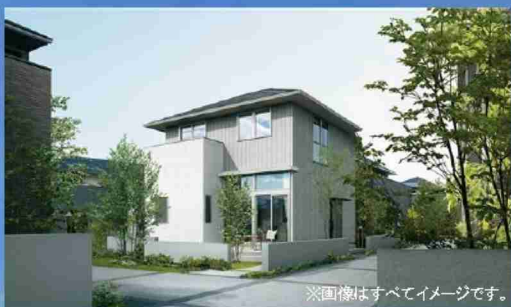
※画像はすべてイメージです。