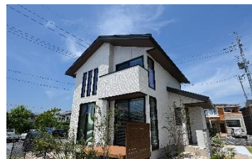
4号地/令和5年8月撮影

【セキュレア旭町II 全体概要】●交通/JR山陽本線「岩国」駅まで車で約5分(約1,620m~1,630m)●総戸数/6戸(うち当社4戸)●用途地域/準工業地域●地目/宅地●建ぺい率/60%●容積率/200%●道路幅員/4m~4.5m(アスファルト舗装)●私道負担/162㎡のうち、6分の1の負担持分(1・4号地)●設備/電気:大和ハウス工業(他の小売電気事業者の選択も可能です)、ガス:プロパンガス、水道:公営水道、下水:浄化槽、雨水:側溝●取引態様/売主:大和ハウス工業株式会社●取引条件有効期限/2024年4月30日 【セキュレア旭町II 分譲住宅概要】●所在地/山口県岩国市旭町一丁目617番6他●今回販売戸数/2戸●区画面積/165.38㎡(1号地)~166.53㎡(4号地)●建物面積/76.26㎡(1号地)~106.49㎡(4号地)●建物構造/軽量鉄骨造2階建(1戸)、軽量鉄骨造平屋建(1戸)●建築確認番号/第HP09-3725790号他●販売価格(税込)/4,460万円(1号地)~4,980万円(4号地)●建物完成年月/2023年8月完成済(1戸)2023年9月完成済(1戸)●引渡可能年月/即引渡可2戸