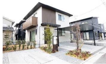
1号地/令和4年12月撮影

【セキュレア川口 全体概要】●所在地/山口県岩国市川口町二丁目2210番6●交通/JR山陽本線「岩国」駅まで徒歩12分●総戸数/10戸(内、当社2戸)●用途地域/準工業地域●建ぺい率/60%●容積率/200%●道路幅員/5m(アスファルト舗装)●私道負担/なし●設備/電気:大和ハウス工業(他の小売電気事業者の選択も可能です)、ガス:オール電化のためなし、水道:公営水道、下水:公共下水道●取引態様/売主:大和ハウス工業株式会社●取引条件有効期限/令和6年4月30日 【セキュレア川口 分譲住宅概要】 ●今回販売戸数/1戸●建物構造/軽量鉄骨造2階建●販売価格(税込)/4,190万円(1号地)●敷地面積/166.79㎡(1号地)●建物面積/97.72㎡(1号地)●工事完了年月/2022年12月完成済(1戸)●引渡可能年月/即引渡可●建築確認番号/第HP09-3646513号