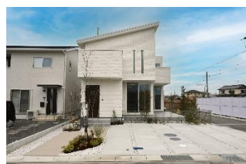
まちなかジューヴォ車町/令和5年9月撮影

【まちなかジューヴォ車町 全体概要】●交通/JR山陽本線「岩国」駅まで車で約5分(約1,950m)●総戸数/7戸(内、当社1戸)●開発面積/2263.82㎡●用途地域/第一種住居地域●開発許可番号/指合建築指導開発検済第2021-7号●地目/宅地●建ぺい率/60%●容積率/200%●道路幅員/4.8m(アスファルト舗装)●私道負担/なし●設備/電気:大和ハウス工業(他の小売電気事業者の選択も可能です)、ガス:都市ガス、水道:公営水道、下水:浄化槽、雨水:側溝●工事完了年月/2021年8月完成済●取引態様/売主:大和ハウス工業株式会社●取引条件有効期限/2024年4月30日 【まちなかジューヴォ車町 分譲住宅概要】●所在地/山口県岩国市車町二丁目609番29他●今回販売戸数/1戸●区画面積/176.95㎡●建物面積/108.47㎡●建物構造/軽量鉄骨造2階建(1戸)●建築確認番号/第HP09-3641481号●販売価格(税込)/4,790万円●建物完成年月/2023年2月完成済●引渡可能年月/即引渡可